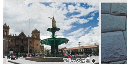
▲市民や観光客が集まるクスコの中央広場。