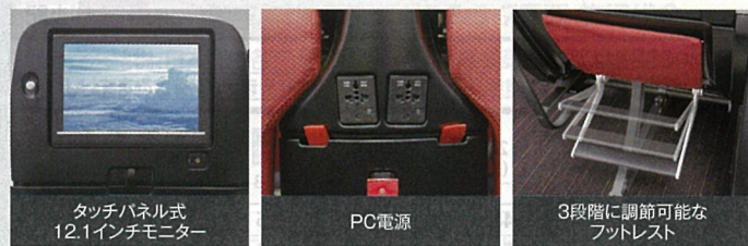
タッチパネル式12.1インチモニター