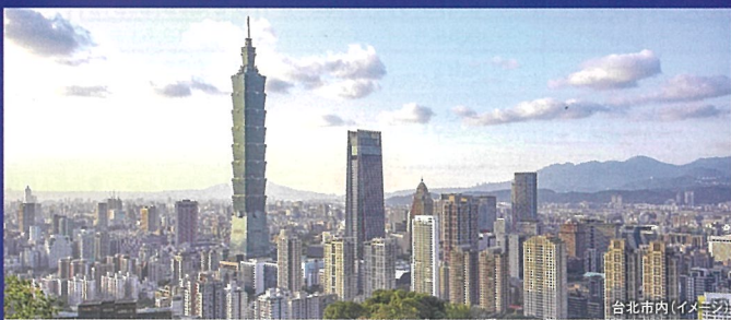
台北市内(イメージ)