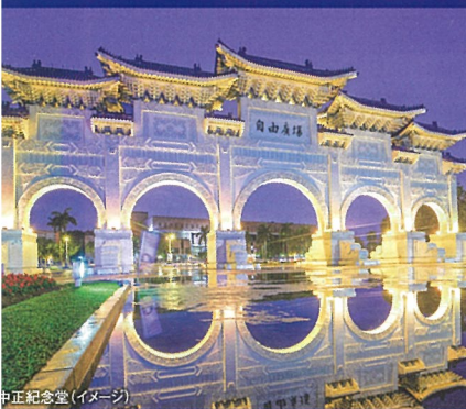
中正記念堂(イメージ)