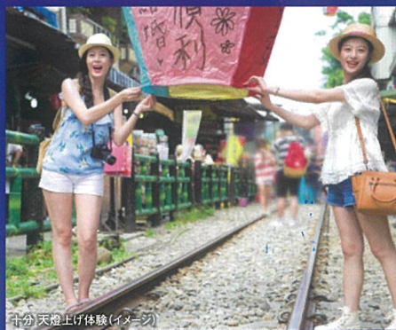
十分 天燈上げ体験(イメージ)