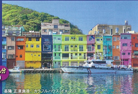
基隆 正濱漁港 カラフルハウス(イメージ)

地下鉄(MRT)等で使用可能!! (チャージすることで繰り返し利用可能) ※デザインの見直しはできません