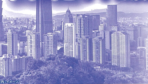
台北市内(イメージ)

● 発着地/那覇空港 ● 出発期間/2023年4月1日～9月30日 ● 最少催行人員/1名様 ※ただし1人部屋追加代金が別途かかります ● 利用予定航空会社/チャイナエアライン ● 添乗員/同行しません現地係員がご案内いたします ● 食事条件(機内食を除く) ● 3日間:朝食2回 ● 4日間:朝食3回 ● 5日間:朝食4回 ● パスポート残存期間/日本国籍の方で台湾滞在期間中(帰国時まで)有効なものが必要です ※但し、出国時90日以上のもが望ましい※パスポート有効残存期間は予告なしに変更となる場合がございます。最新の情報を必ずご確認ください。