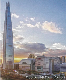
ロッテワールドタワー(イメージ)