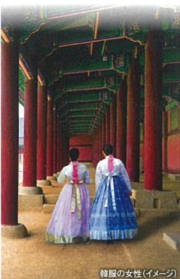
韓服の女性(イメージ)